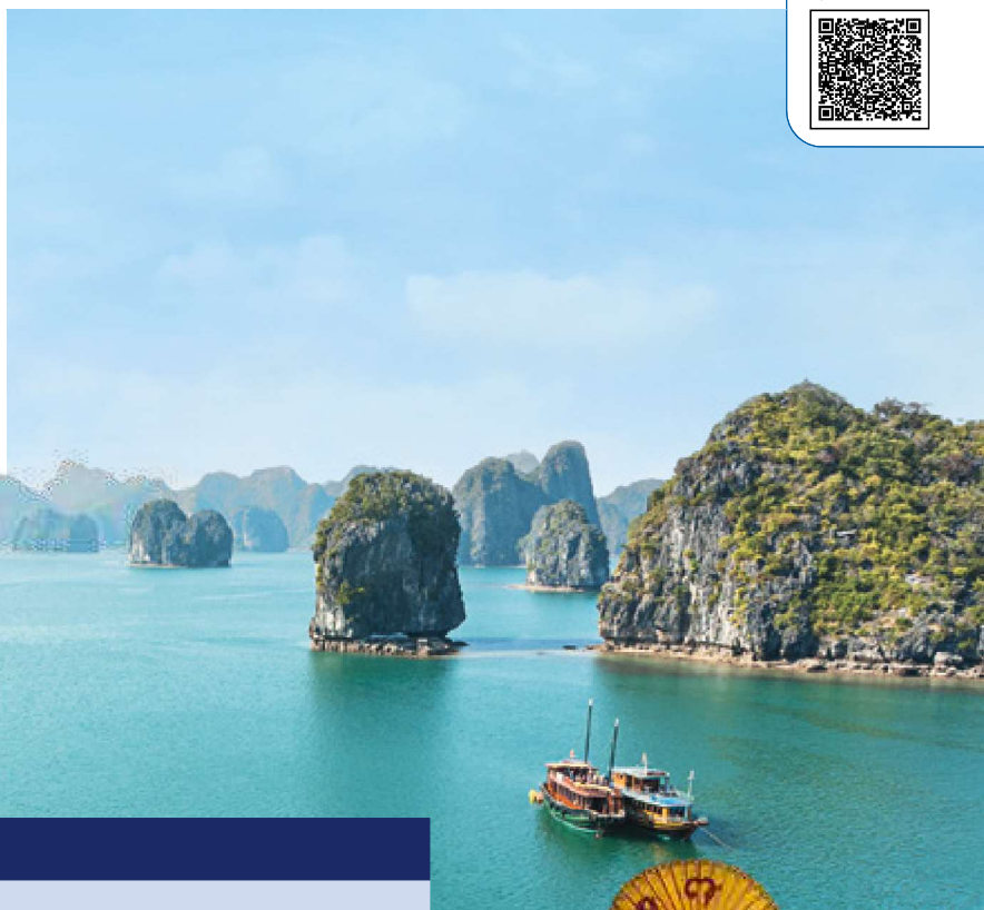
Bahía de Ha-Long, Vietnam