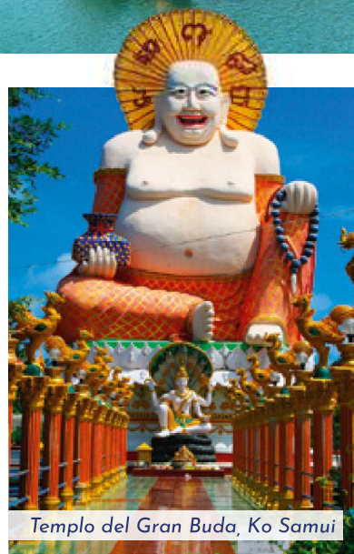
Templo del Gran Buda, Ko Samui