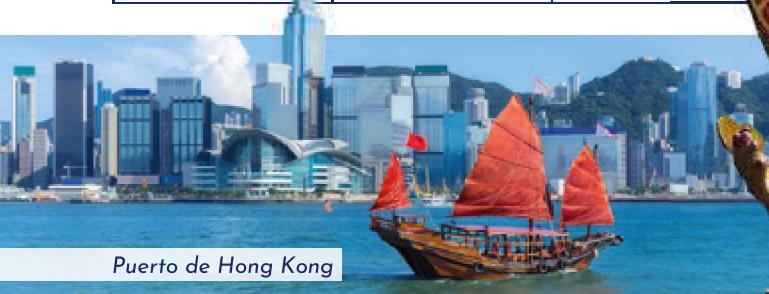
Puerto de Hong Kong

Salida sujeta a un mínimo de 20 personas. Información y reservas en tu Agencia de Viajes. El paquete no incluye: bebidas en almuerzos o cenas, excursiones en los puertos de escala del crucero, propinas a bordo del crucero, maletas y guías, seguro de asistencia en viaje y gastos de cancelación, visados o cualquier otro servicio no especificado.