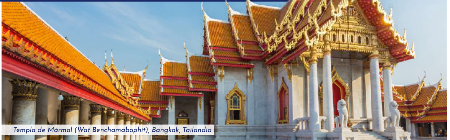
Templo de Mármol (Wat Benchamabophit), Bangkok, Tailandia